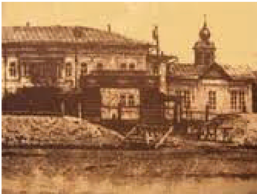
Хүрээн дэх Хаант Оросын Консулын газар

Оросын консулын газрын 2 давхар байшингийн зургийг офицер П.Роголёв зурж мөн барих ажлыг нь хариуцан хийжээ. Оросын засгийн газар тус байшингийн барилгад нь 1861 оны 8 сард 20 мянган рубль, тавилгад нь 2 500 рубль гарган өгсөн байна. Мөн хожим нь 6 253 руб. нэмж олгосноор Консулын газрын байшинг 1865 онд барьж дуусан ашиглалтанд оруулжээ. 17 Тус байшин нь хоёр давхар модон байшин бөгөөд гадуур нь тоосго өрсөн, байшингийн зүүн талд Сүм 18 байрлаж байжээ.