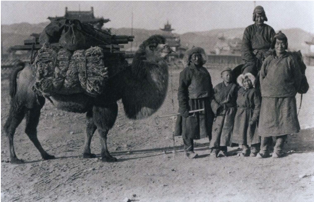
Их Хүрээнд хүрэлцэн ирсэн жинчид