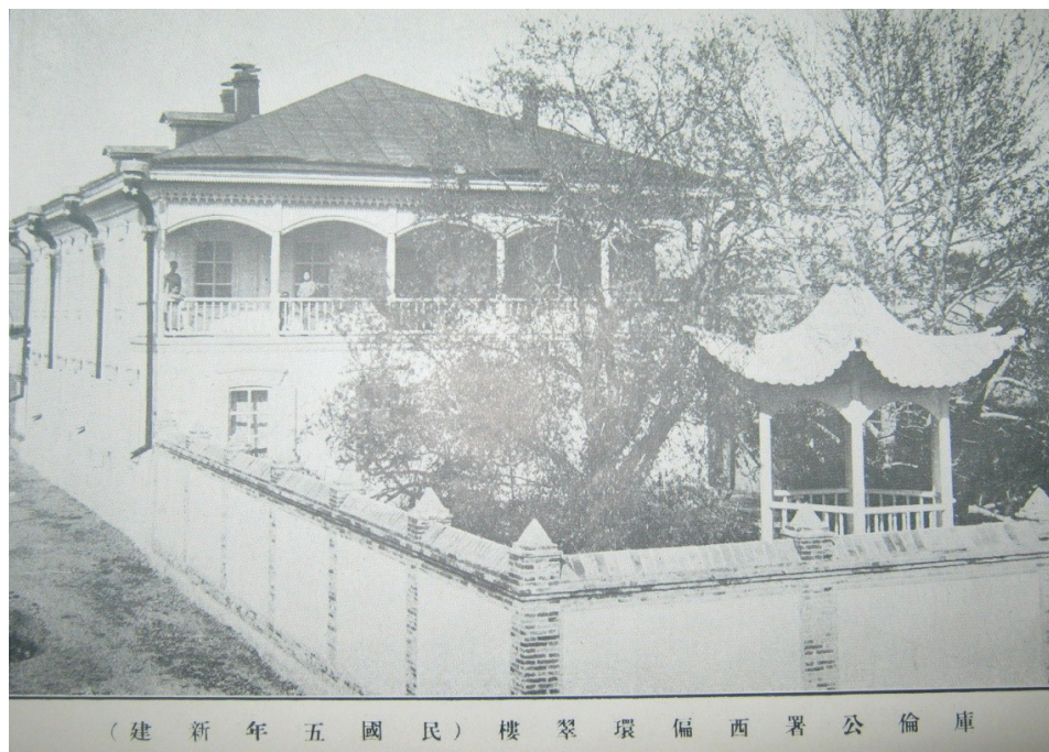
Их Хүрээн дэх манж амбаны байр

Төр гэрэлтийн 19-р (1839) онд Хүрээг Туул голын хөвөөнд нүүлгэснээс хойш Хүрээний хуучин газар худалдаачид шилжин ирэх урсгал улам эрчимжиж, улмаар мөн Төр гэрэлтийн 22-р (1842) онд нэгэнт тус газарт сууж буй хятад иргэдэд суурьших эрхийг албан ёсоор олгосон байна. 24