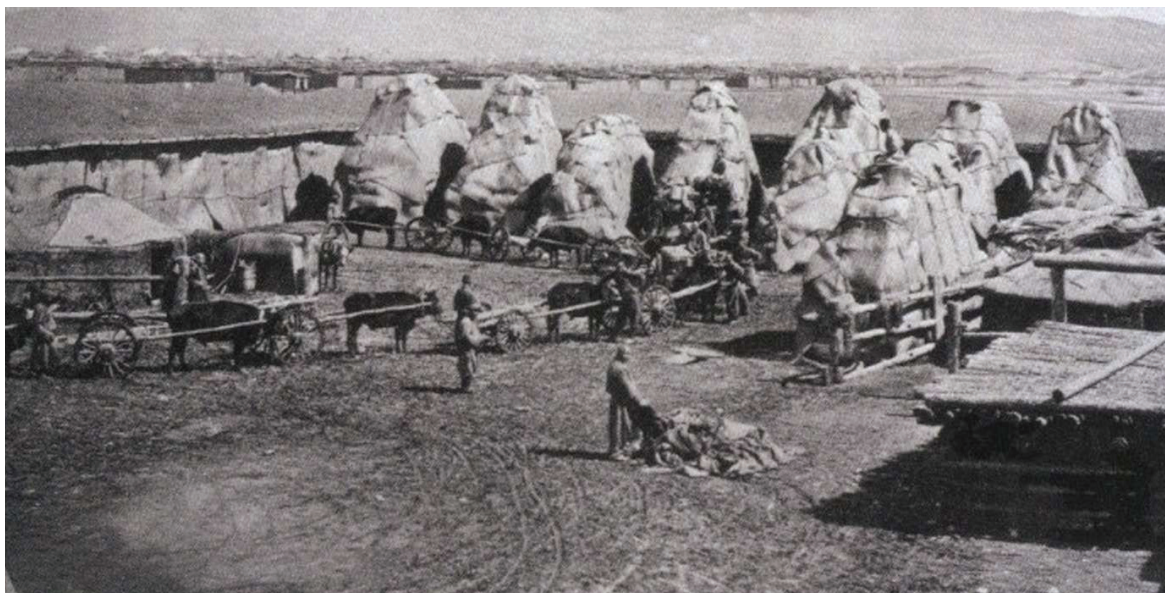
Их Хүрээний буудалсан цайны жинчид Хиагт руу хөдлөхийн өмнө

Их Хүрээ нь зөвхөн Монголын бурхан шашны том төв төдийгүй, худалдааны их зам дээр орших хот болон төлөвшин тогтох үйл явц чухамдаа бидний өгүүлэн буй үед холбогдох аж. Тус хотод Халхын зүүн хоёр аймаг болох Сэцэн хан, Түшээт хан мөн Богдын Их Шавийн захиргаа оршиж байсан учир засаг захиргааны төв болж байсан амуй.